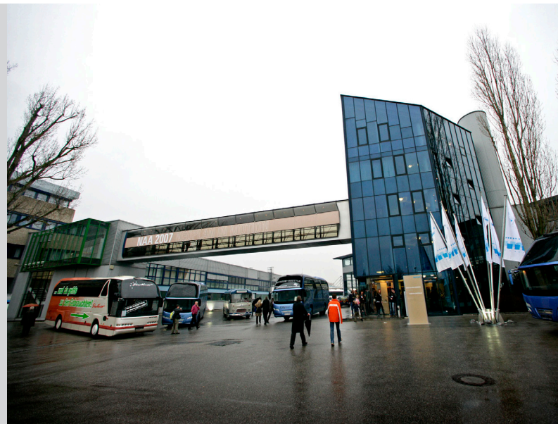
das ehemalige NEOPLAN Werk Pilsting